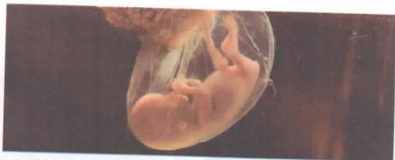
▲ Una de las preguntas existenciales de todos los tiempos ha sido: ¿estarnos aquí por el azar o nuestra existencia estaba determinada?

©mave EDUCACIÓN – Ejemplar sin valor comercial – Prohibida su venta