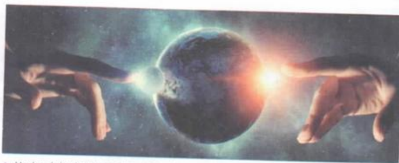
▲ Muchas de las discusiones deterministas intentan definir cuál es la causa primera. Para la religión, Dios es la causa primera.

De acuerdo con esto, se puede afirmar que casi toda la ciencia moderna descansa y depende del principio de razón suficiente, debido a que el conocimiento de las ciencias se fundamenta en proposiciones o axiomas que requieren una explicación lógica y comprobable de su causa y su efecto .